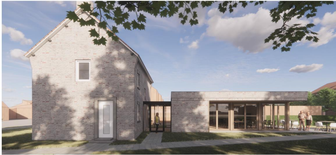
Impressie woning Dokter Smitslaan 13